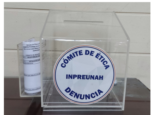
El buzón de denuncias se encuentra ubicado en el área del comedor.