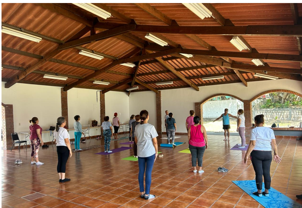
7 de marzo 2024. Clase de yoga realizado en el club del BCIE.