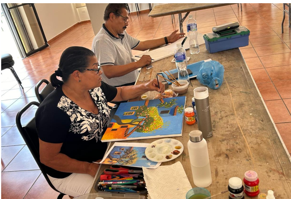
14 de marzo 2024. Clase de pintura.