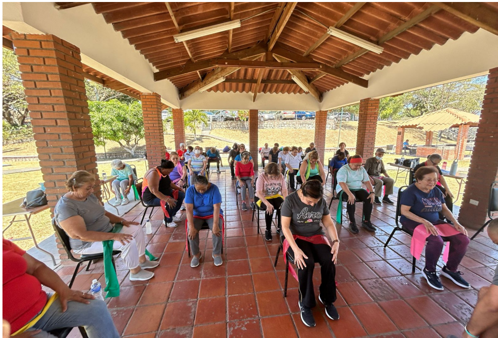
28 de febrero 2024. Actividades físicas realizadas con los pensionados del Instituto en el club del BCIE.