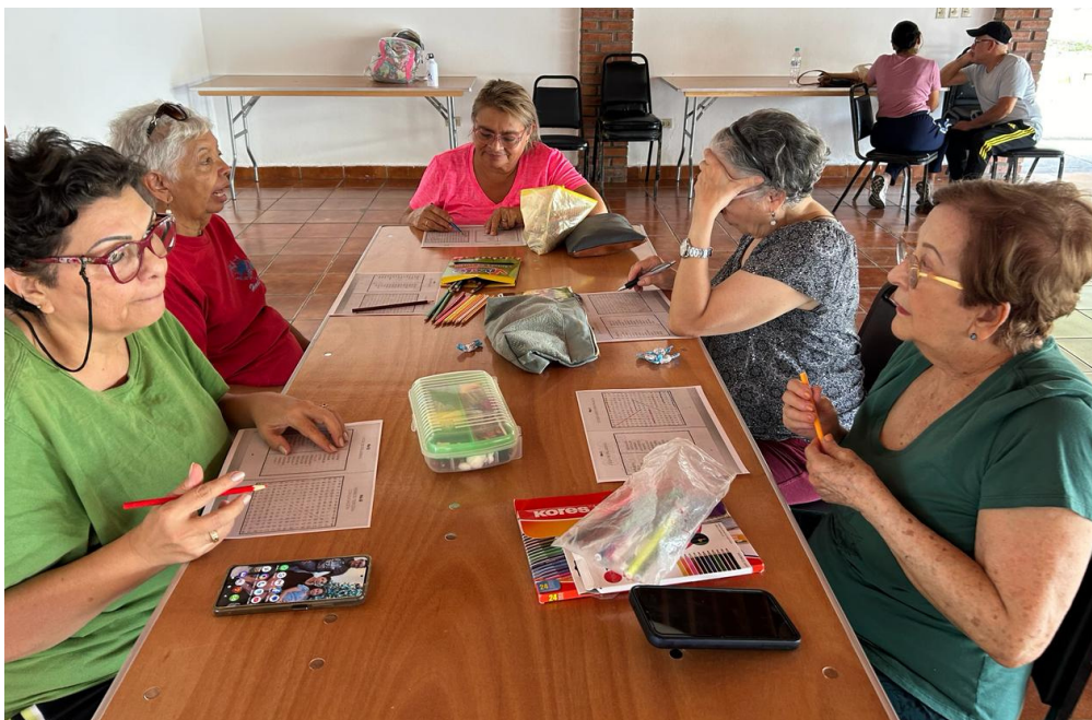
14 de marzo 2024. Terapia cognitiva.